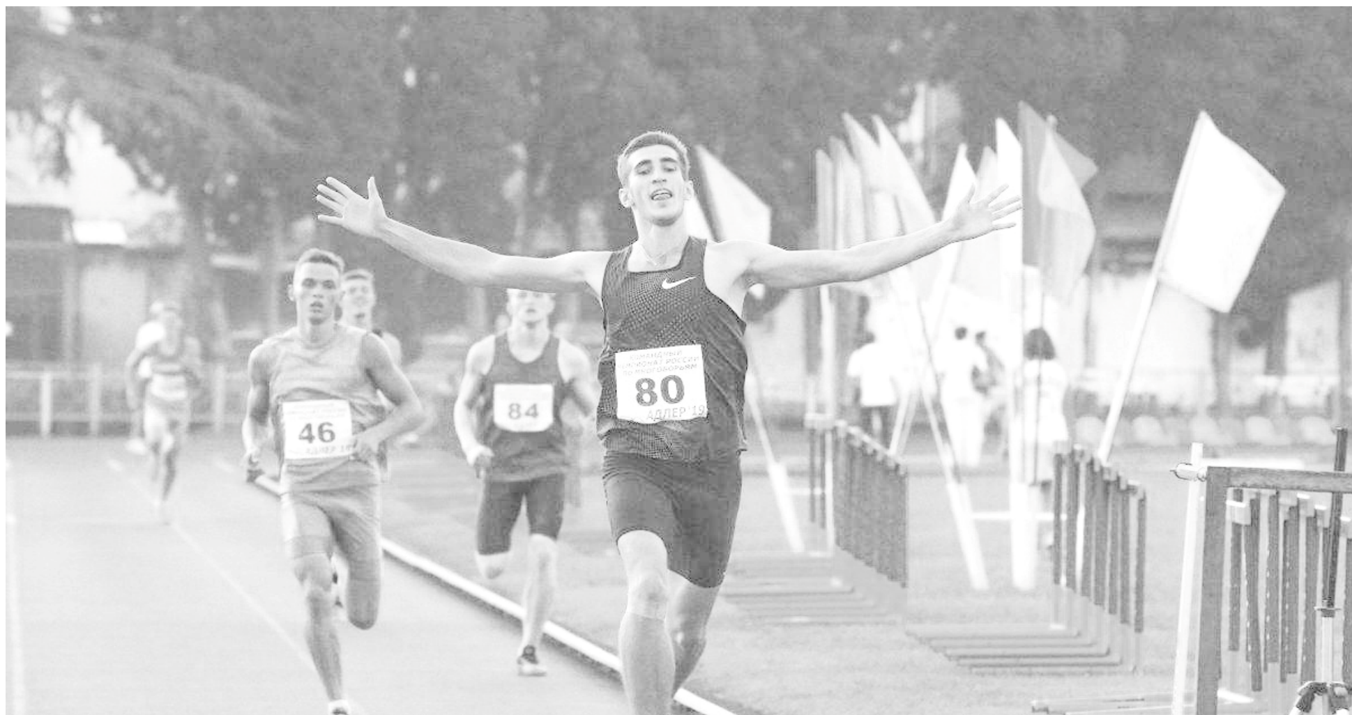
г. Сочи, Адлерский район, стадион "Юность" 21-24 сентября 2020 г.